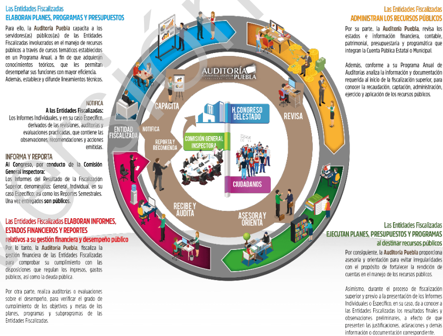
Diagrama 1 Proceso de Fiscalización Superior 2017